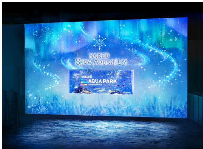
「BRIGHT SNOW ※イメージ」

また、映像演出は壁面だけでなくゲストのお足元にまで広がり、冬の美しさを体感的にお楽しみいただくことで入口からスノウアクアリウムの世界観へと深く引き込みます。